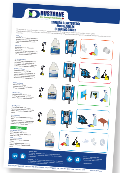
Tableau mural personnalisé